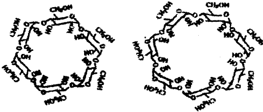
图 1 \alpha 、 \beta -环糊精的环状结构

分析提供了数据,由于环糊精母体和一些衍生物,有较高的熔点,很多人把它们溶于中等极性的聚硅氧烷(如 OV - 1701)中形成混合固定相。环糊精衍生物的商品柱多为用在 OV - 1701 稀释的混合固定相。1999 年 Schurig 把全甲基环糊精接枝到聚硅氧烷上,成为侧链甲基环糊精聚硅氧烷固定相,这种固定相容易涂渍,耐热性好。北京理工大学的傅若农教授的研究组所研究的环糊精衍生物如全烷基 - 环糊精、苄基取代环糊精衍生物、带杂环化合物取代基的环糊精、月桂酸脂基 - 环糊精等,都是直接涂渍在毛细管柱上。武汉大学的吴采樱教授的研究组也在带有冠醚的环糊精衍生物气相色谱固定相方面做了很好的研究。 [8] 国外用直接涂渍环糊精衍生物或用聚硅氧烷作稀释剂组成手性固定相的报告近年仍然大量出现。 [9,10] 傅若农教授合成的侧链甲基环糊精聚硅氧烷固定相为中科院化学所、动物所分离乳酸酯对映体和信息素对映体取得了很好的效果。 [11]